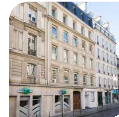
Investissement déjà réalisé : Immeuble Berryer, 75008 Paris**